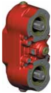
DUAL POWER (12-30)