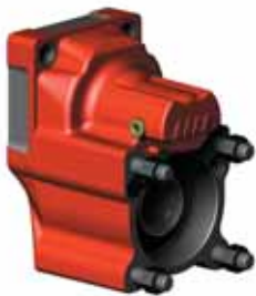
POWER TRUCK (16-31/32/33)