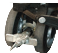
Kojinis stabdys padidina saugumą.